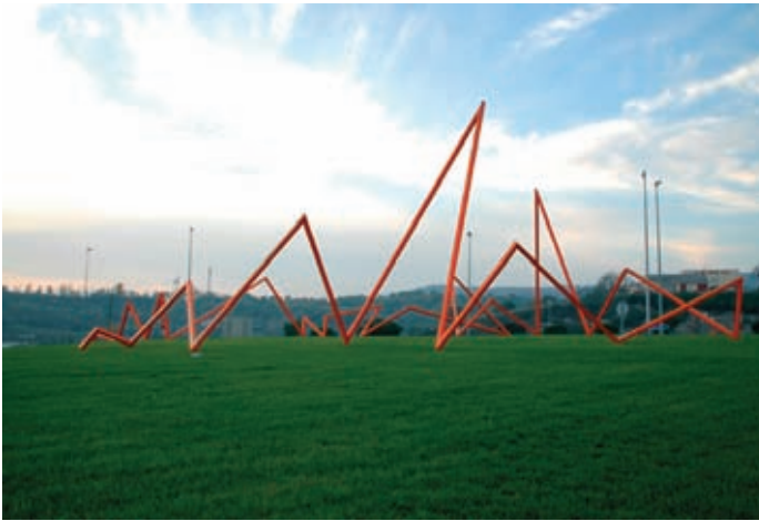
El retorn de l'escultura va ser reivindicat popularment