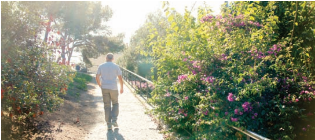
El Parc de la Llàntia afrontarà petites millores