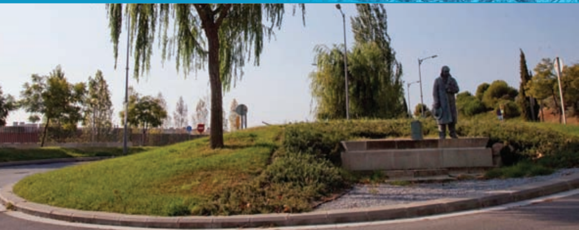
La plaça d'Antonio Machado al barri de Cirera