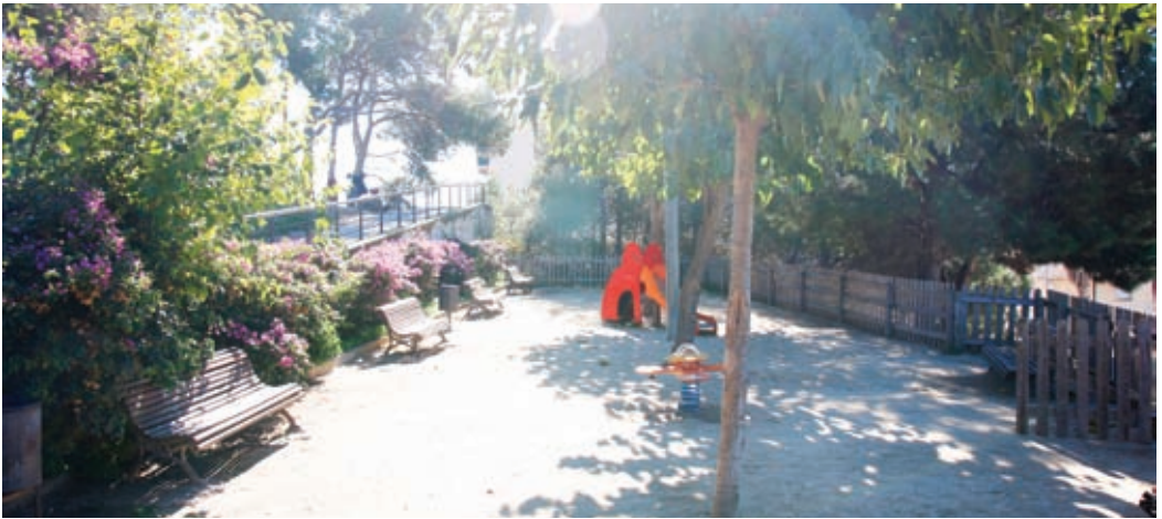
Aquesta és la primera actuació de més que vindran al voltant d'aquesta zona